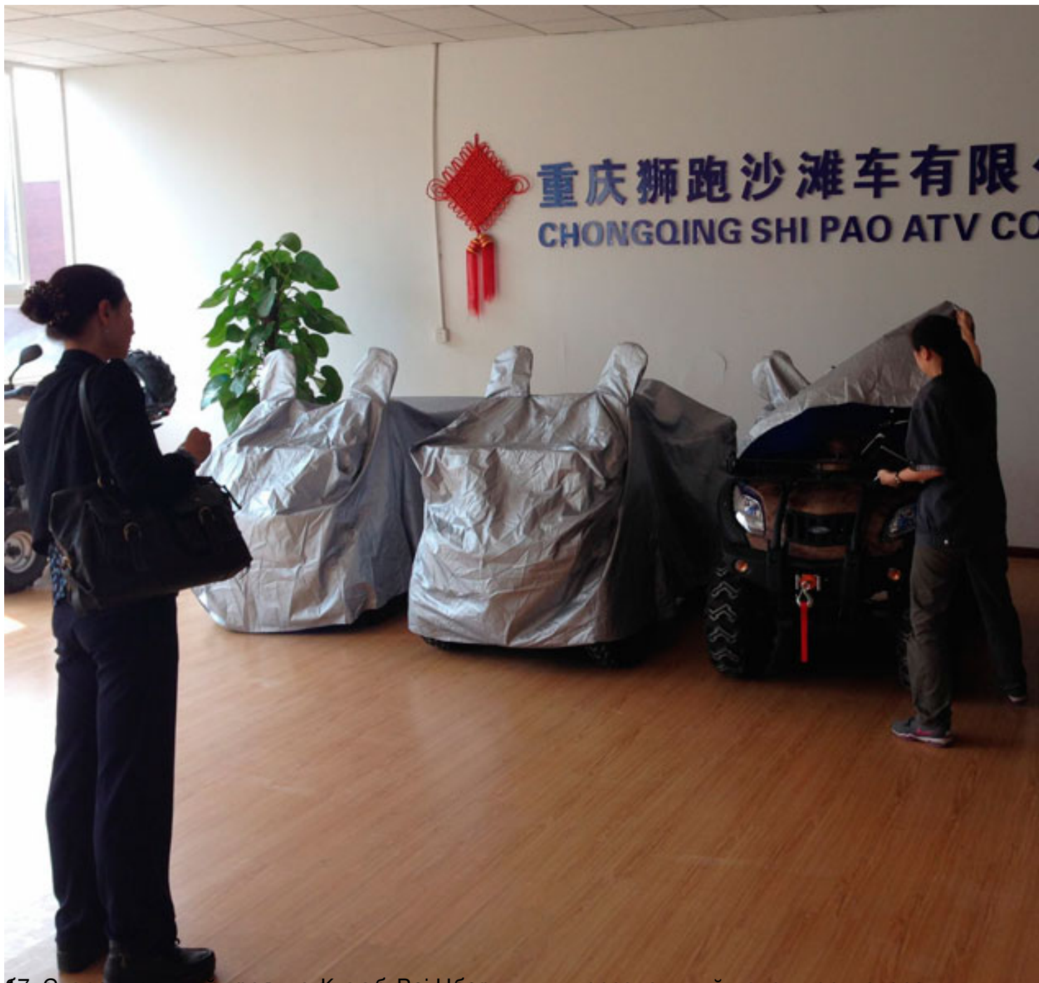
будет в окружении производителя бу Вайна – персональный менеджер, которая