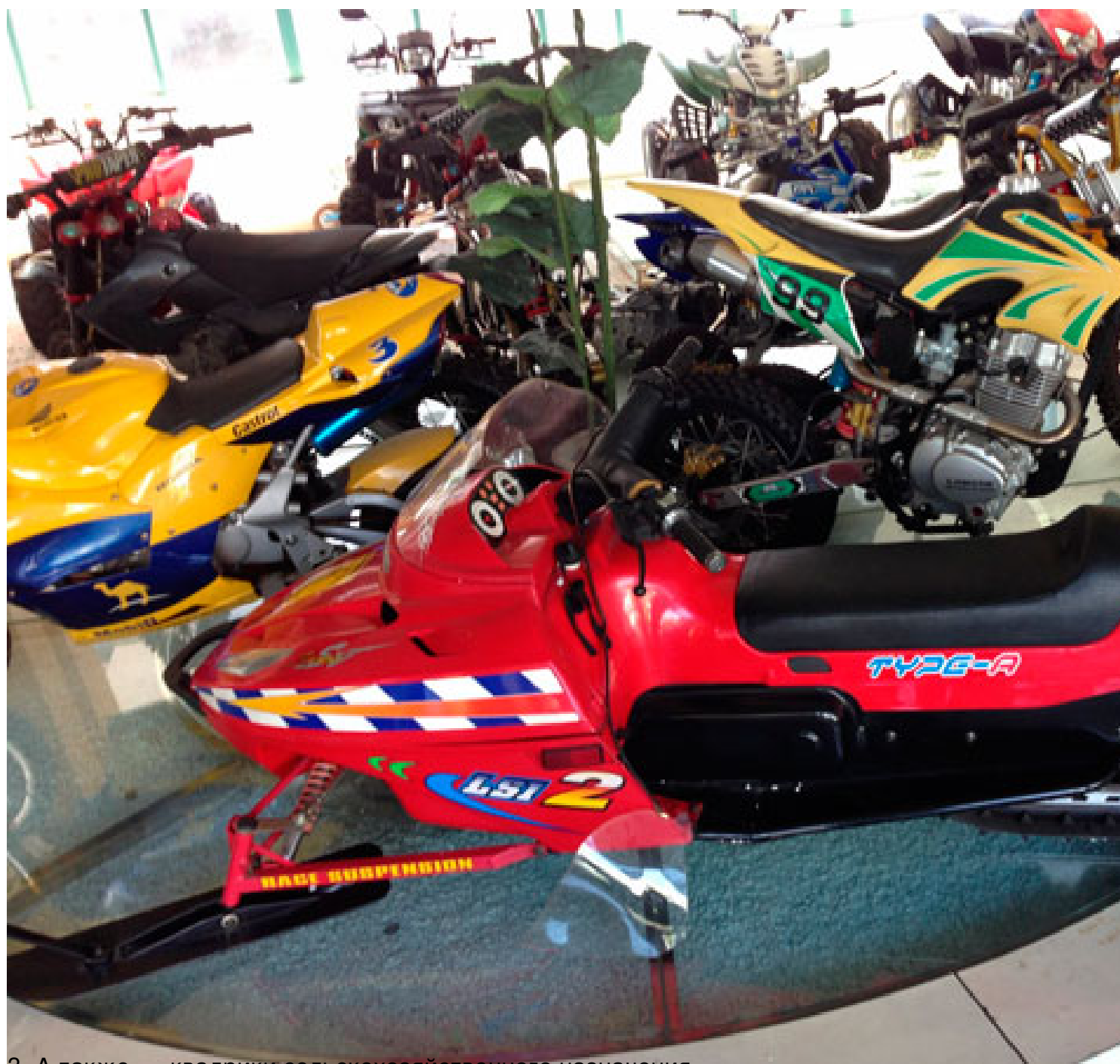
3. А также — квадрики сельскохозяйственного назначения.