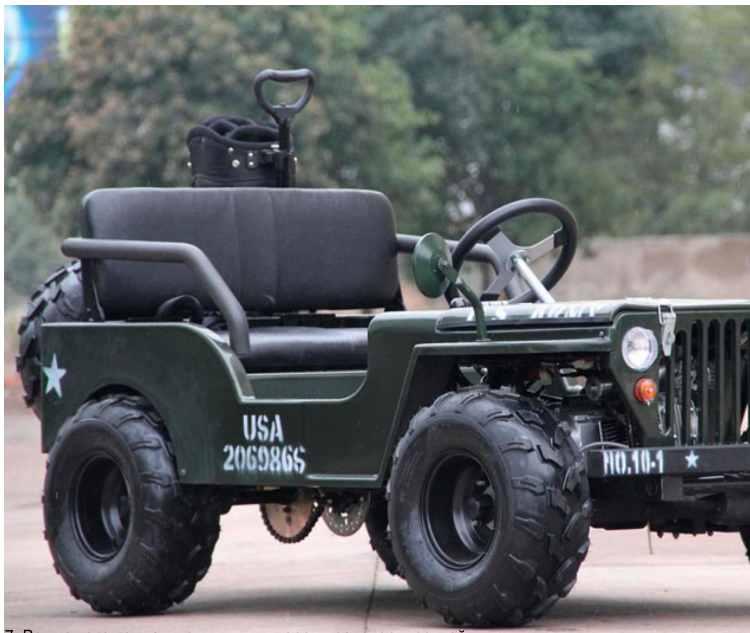
7. Вот как это компактно выглядит перед транспортировкой.