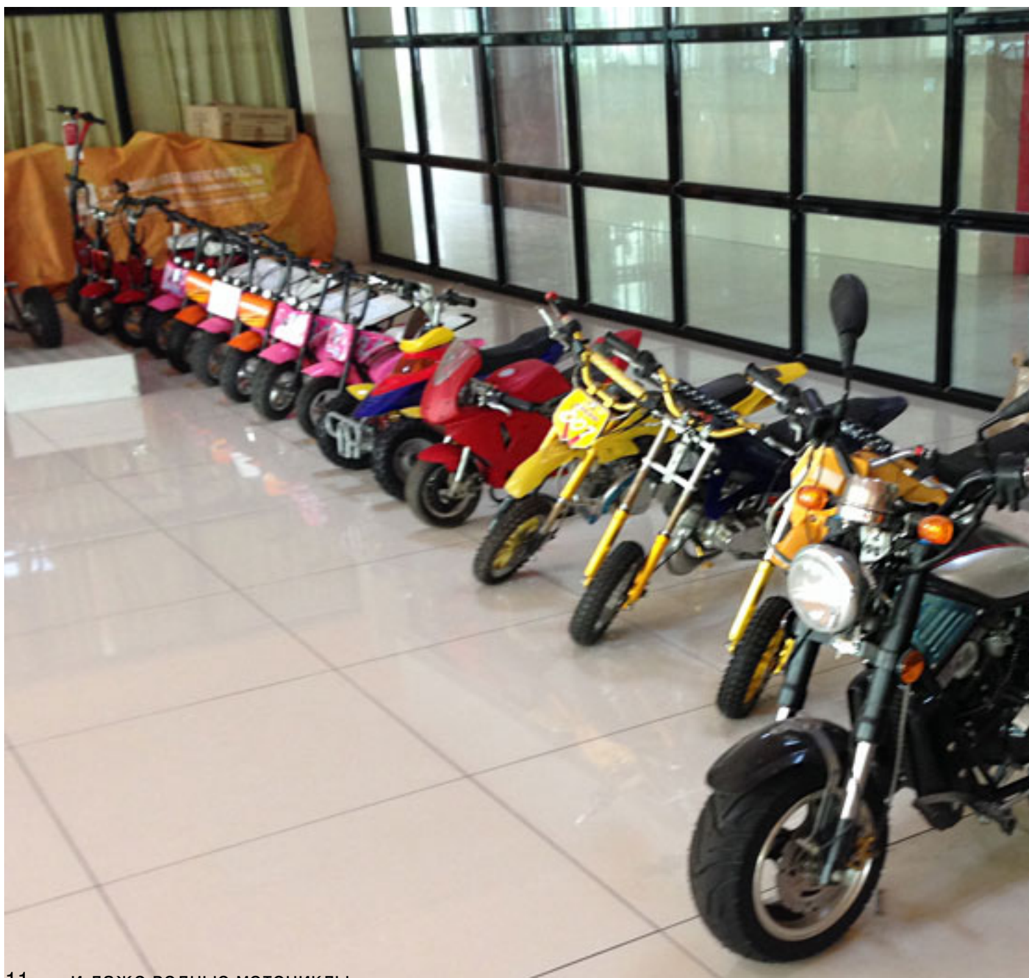
11. ... и даже водные мотоциклы.