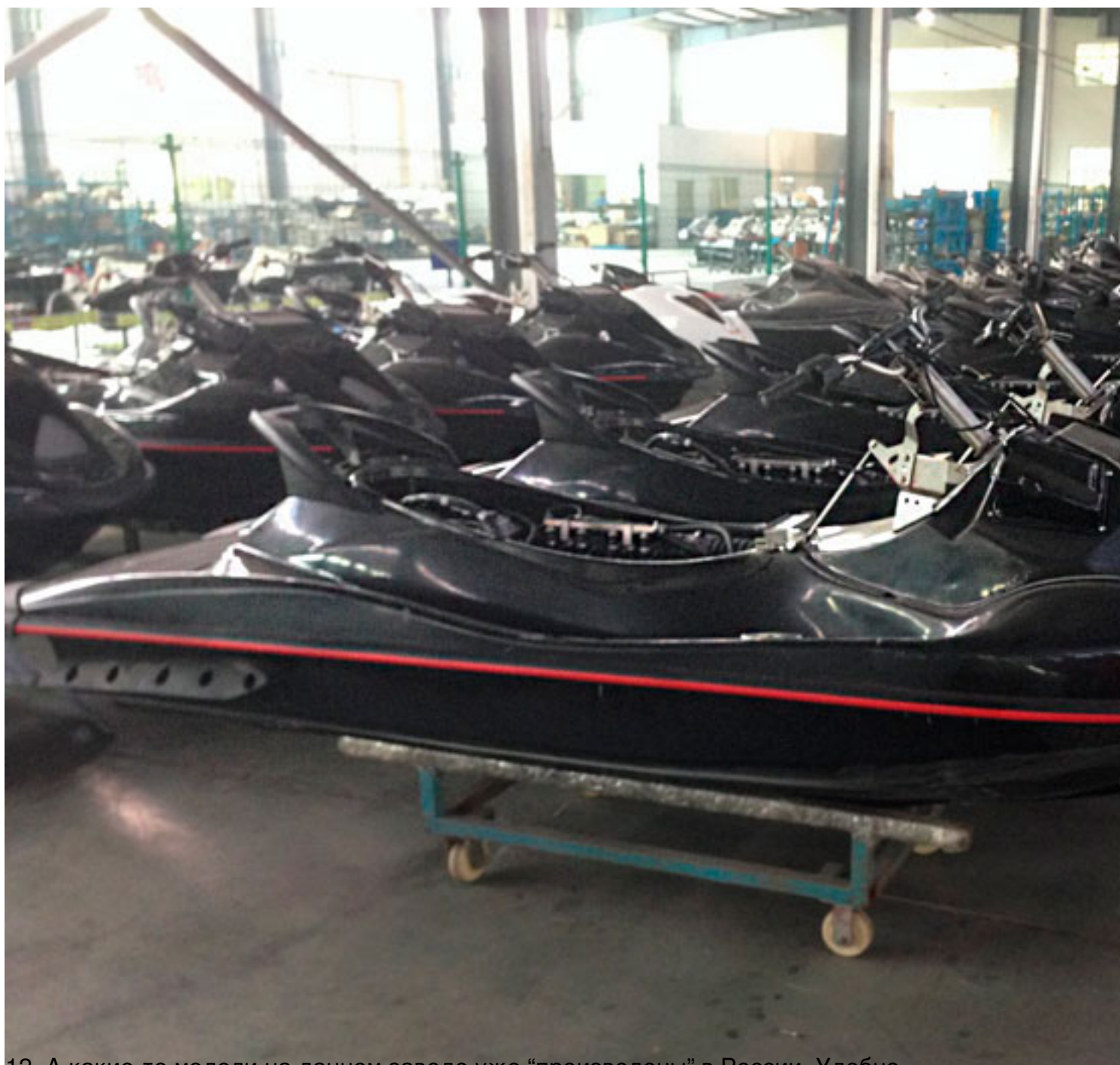
12. А какие-то модели на данном заводе уже “произведены” в России. Удобно.