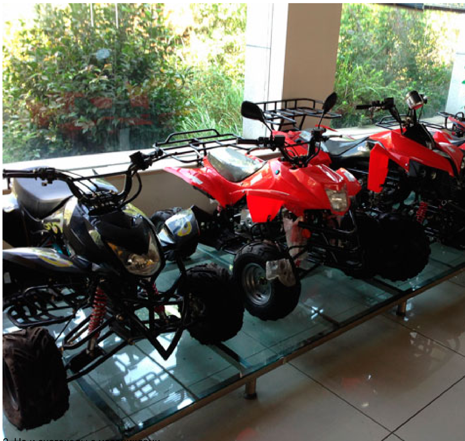
2. Но и снегоходы с мотоциклами.