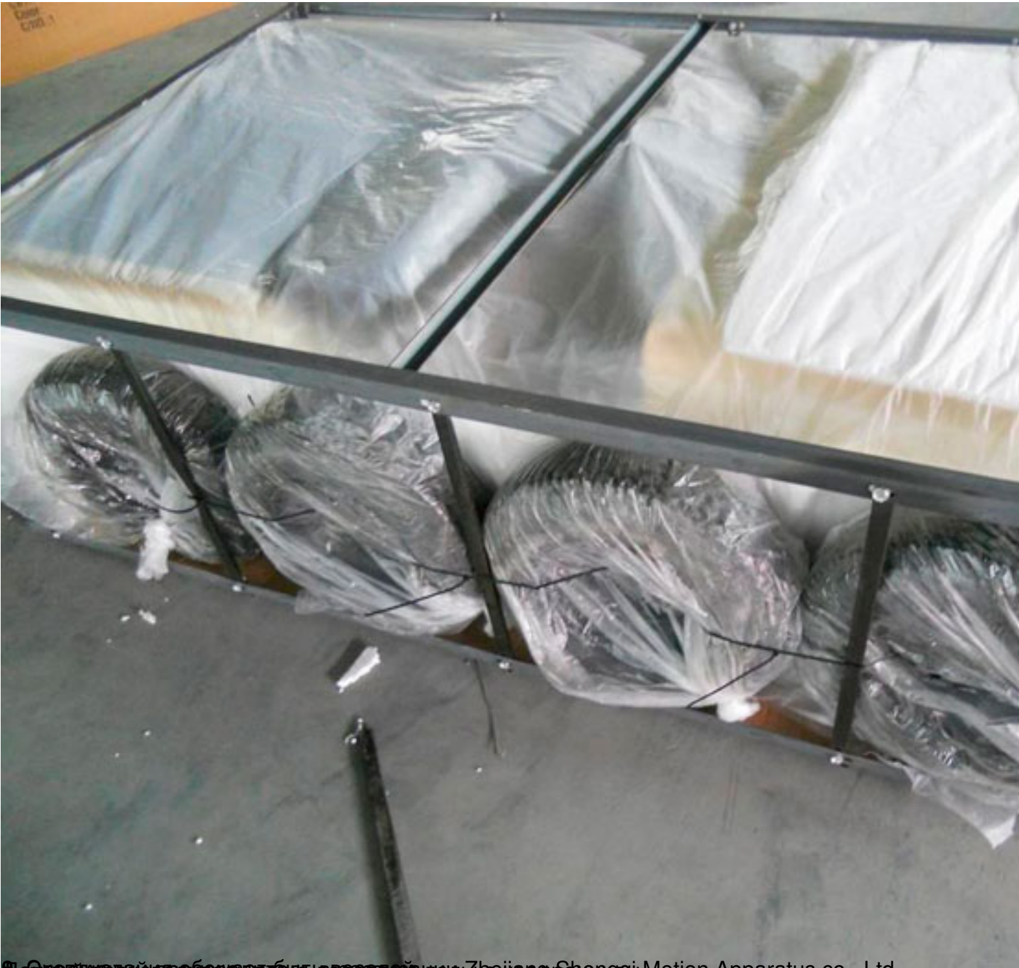
Данная информация предоставлена компанией Zhejiang Shengqi Motion Apparatus co., Ltd.