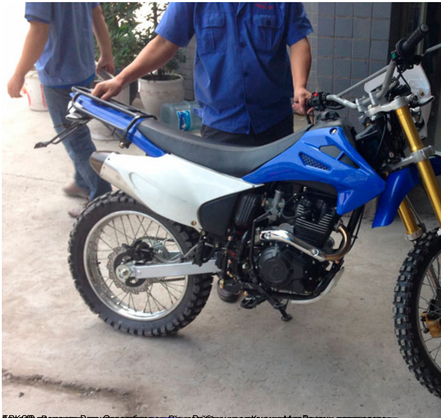
Вид сзади на квадроцикл с двигателем 150 см 3 и объемом бака 12 л. Фото сделано в Китае, на территории завода-производителя.