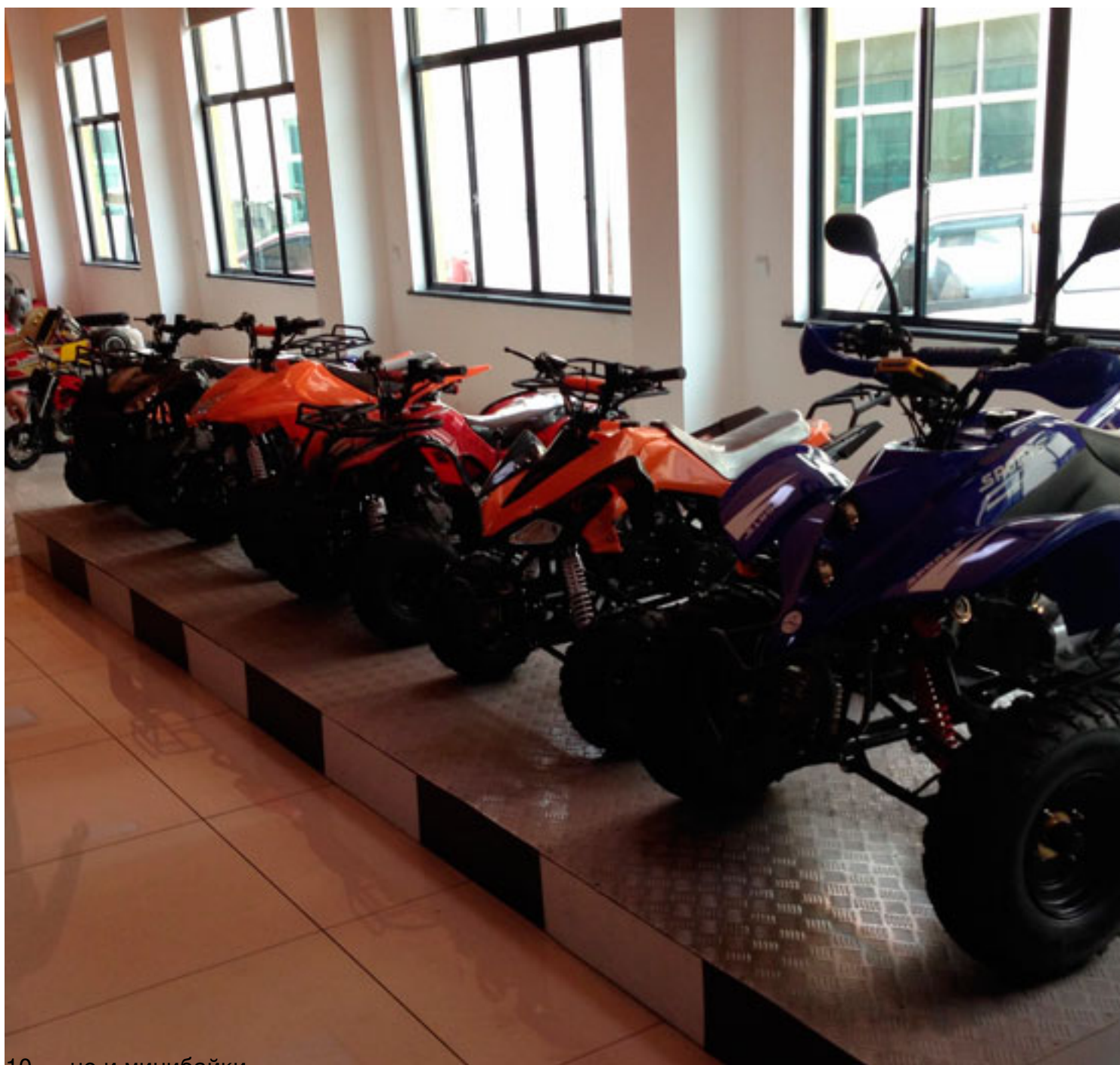
10. ...но и минибайки...