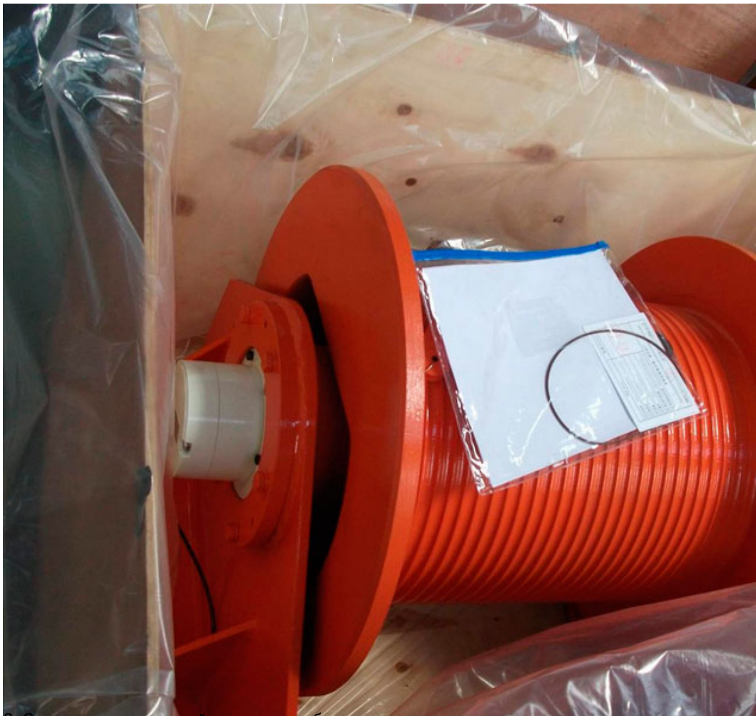
Щитовые кабели для российских компаний изготавливаются на стандартных импортных вращающихся