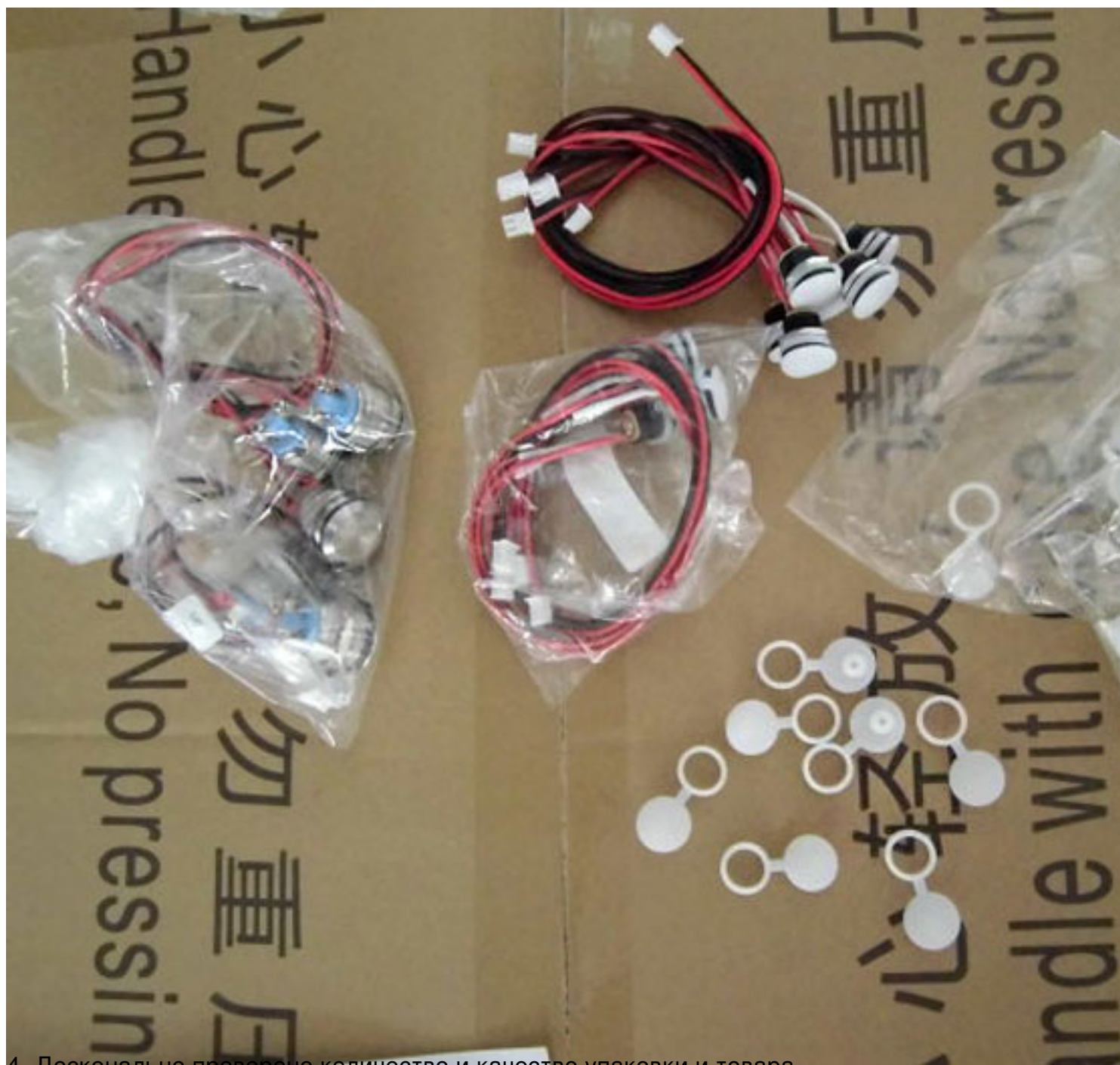
4. Досконально проверено количество и качество упаковки и товара.