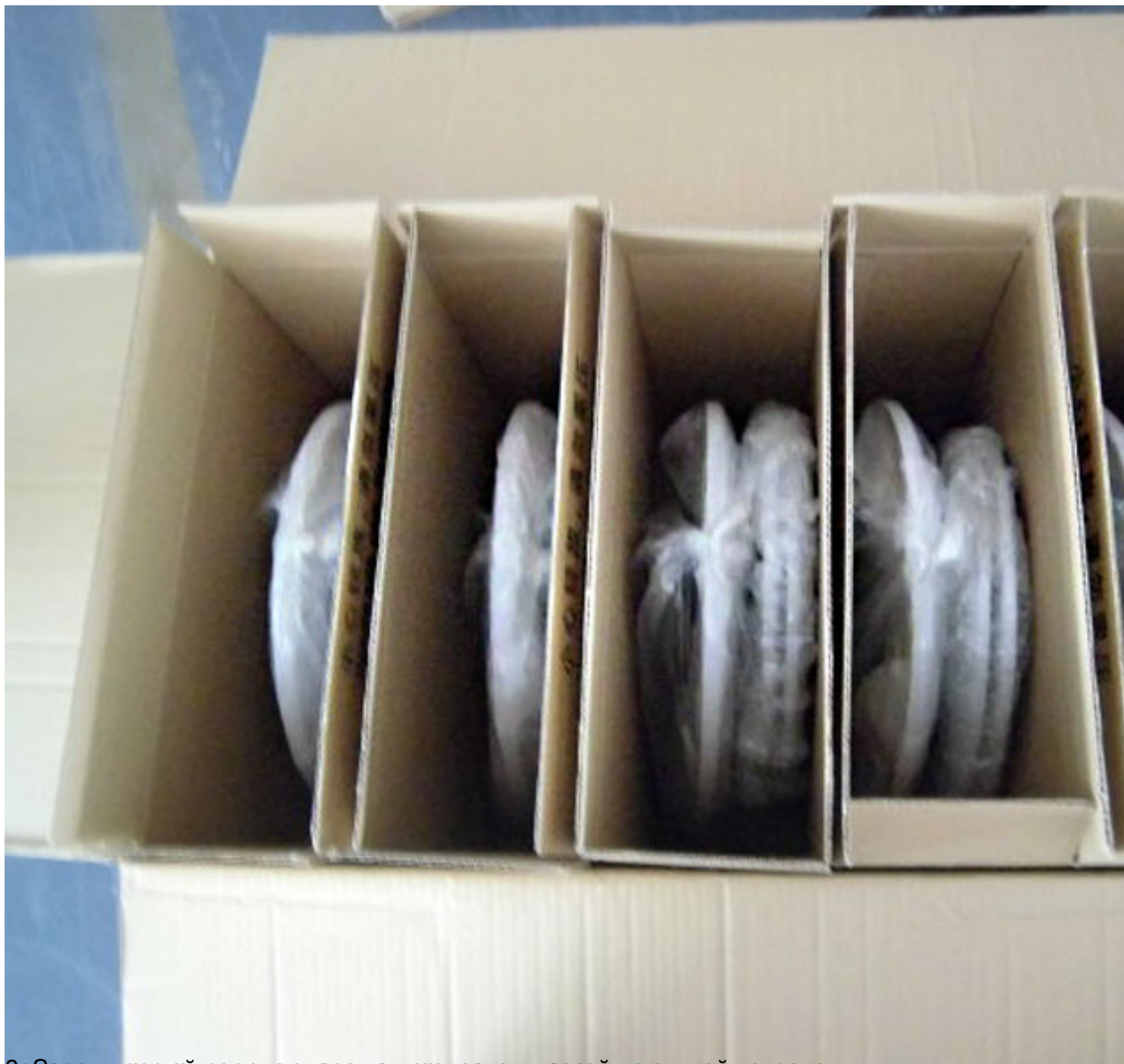
Внедрение в работу системы контроля качества на случай устранения