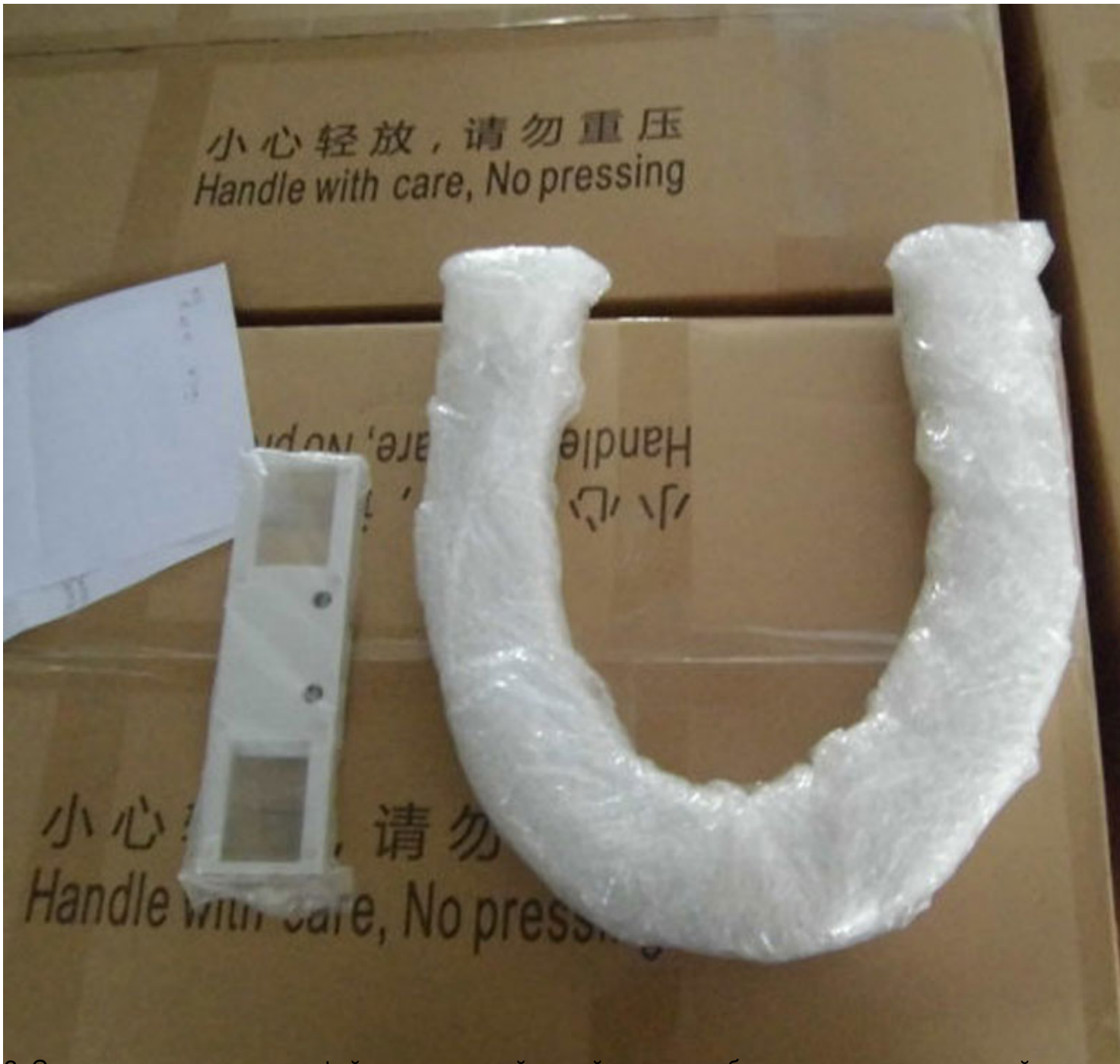
Вид с другой стороны упаковки стульчака, то в другой стороне упаковки отсутствуют повреждения