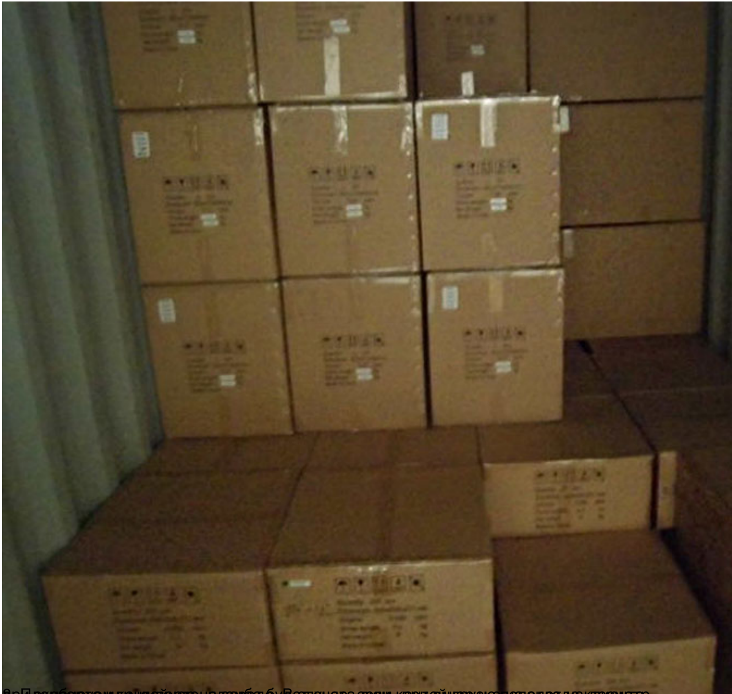
В процессе сборки контейнера на заводе. Велюнаса етошь корте в н еру же по а д а д а к д о с н а р